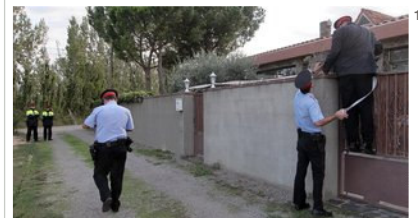
Una patrulla dels Mossos encintant el domicili de l'acusat, als afores de Sant Pere Pescador