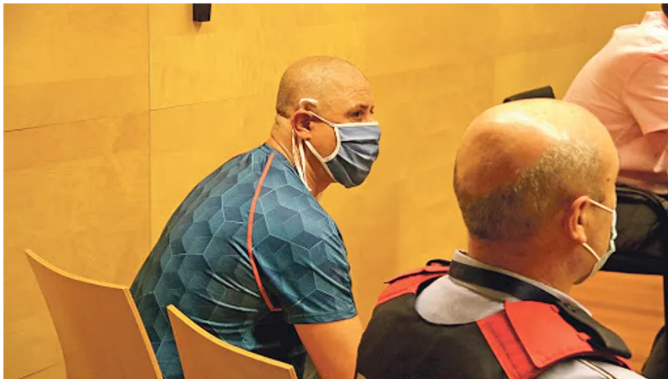
▲El acusado del asesinato, en el primer día del juicio Google

Fue una venganza después de que los servicios sociales no le dieran lo que pedía