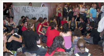
Els estudiants de la UAB el dia 29 de maig quan van ocupar el deganat de la Facultat de Filosofia i Lletres